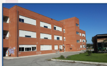
Presentazione sede Via Y. De Bagnac

*clicca sui riquadri per visionare il materiale