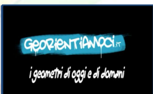
Geometri di oggi e di domani